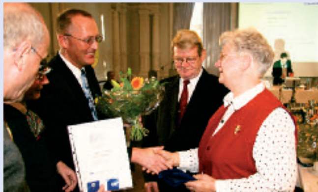
„Es war eine große Freude, den Jubilaren persönlich gratulieren zu können“