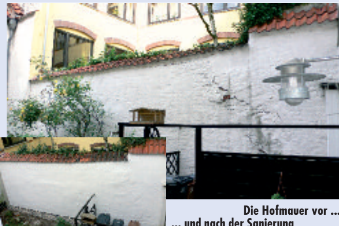
Die Hofmauer vor ... ... und nach der Sanierung

Im Zusammenhang mit den Feiertagen hat die Geschäftsstelle des Mietvereins Lübeck am 24. und 31. Dezember 2008 sowie am 2. Januar 2009 geschlossen. Am 29. und 30. Dezember ist jeweils von 9.00 bis 13.00 Uhr geöffnet.